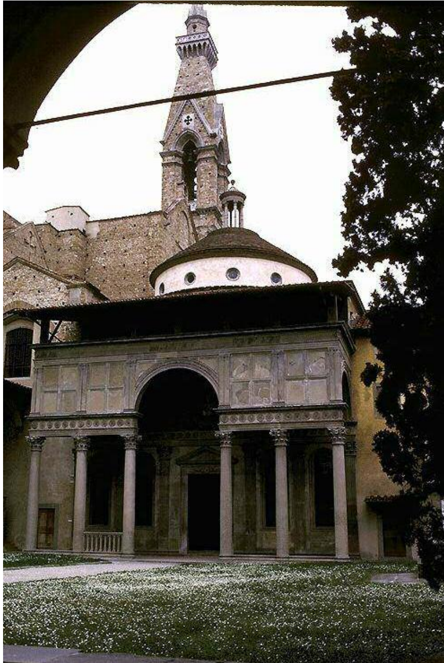
دیمه‌نیکى کلیسای پازی Pazzi chapel

هونه‌ری ئه‌وروپى سه‌ده‌گانی ناوه‌پراست و پینسانس ۲۵۹